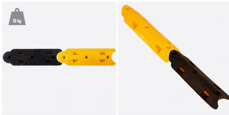
PRODUCTOS FABRICADOS CON FILTRO UV 8.000 HS. (27 MESES)

ALTURA: 4,5 cm. PESO: 10 kg. (Mt. Lineal) MEDIDAS: 50 x 16 cm (Por módulo) REFLECTIVO: Lente Acrílico Prismático 5 cm. x 2 cm.