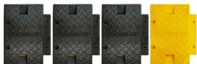
MP 2012 AM - MP 2012 LE AM